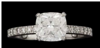
TIFFANY & Co Bague en platine ornée d'un diamant 10 000 €

Expertissim, site Internet d'objets d'art, design, bijoux & vintage expertisés et garantis, présente aujourd'hui une sélection de bijoux et de montres grandes marques, vintage, précieux, uniques. Pour celles et ceux qui souhaitent faire des cadeaux d'exception pour la St Valentin, rendez-vous sur www.expertissim.com , dans la rubrique bijoux (plus de 500 références précieuses en vente) et dans la rubrique montres (plus de 70 modèles d'exception proposés).