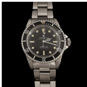
Rolex Submariner. Ref : 5513. (IV/68) 4 500 €