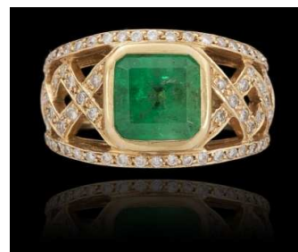
Bague or jaune sertie d'une émeraude et de diamants 2 075 €