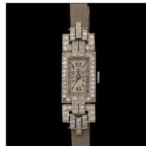
Montre-bracelet femme rectangulaire en platine des années 30. 1 925 €